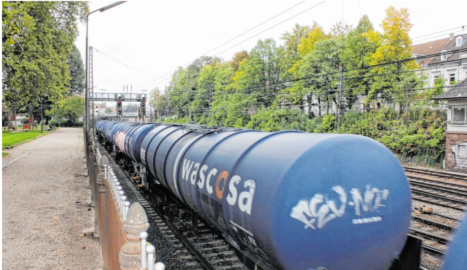
Die Bahntrasse verläuft in Offenburg in einem Graben mitten durch die Stadt. Derzeit fahren dort Regionalbahnen, ICEs – und auch Güterzüge.